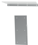
Riser superiore e laterale