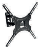
Staffa a muro orientabile